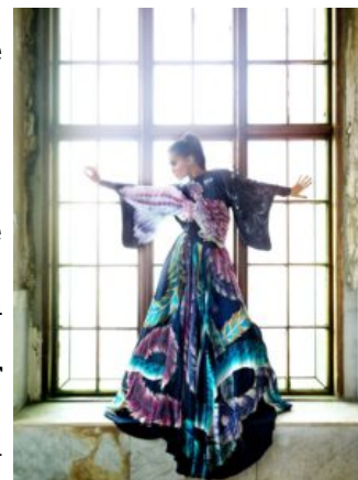
Leila Hafzi per EmmaDante

Leila Hafzi , stilista di moda etica, norvegese di origine iraniana, e Giuseppina Fermi , designer di gioielli piacentina, vestono Emma Dante per il debutto scaligero . La regista palermitana, nota per l'audacia visionaria delle sue scelte artistiche, opta per un look in chiave semiotica: un abito che raffigura un rapace dipinto a mano per volare alto e un gioiello-talismano per conquistare il cuore dei loggionisti .