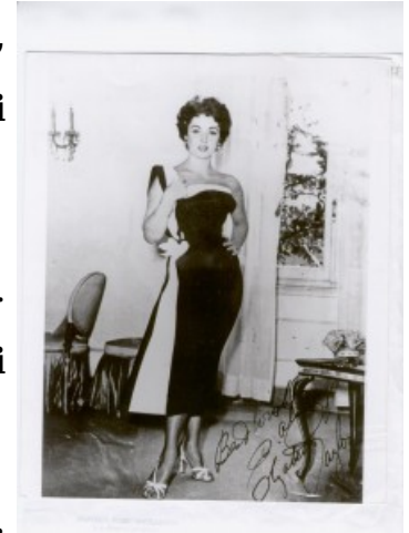
Liz Taylor abito Sorelle Fontana