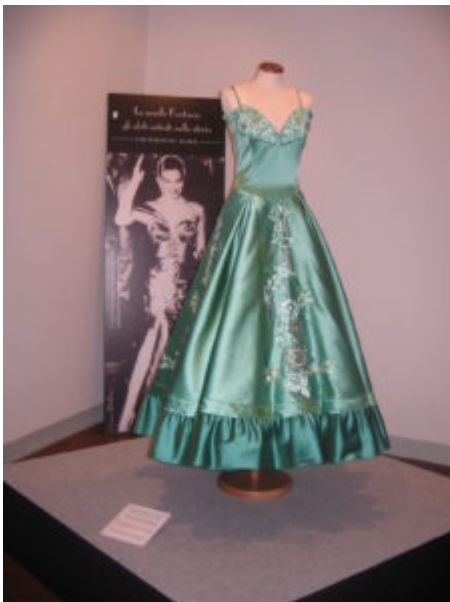
Abito Sorelle Fontana per Ava Gardner

“Si rifiutavano a mostrarsi non eleganti. Non andrebbero in giro come si va oggi. Credo che Audrey come Ava Gardner non potrebbero lasciarsi sedurre dalla moda volgare. Erano contrarie al cattivo gusto. Eleganza è il contrario di complicato. Oggi le donne accettano lo stile volgare, lo subiscono, ma senza entusiasmo“.