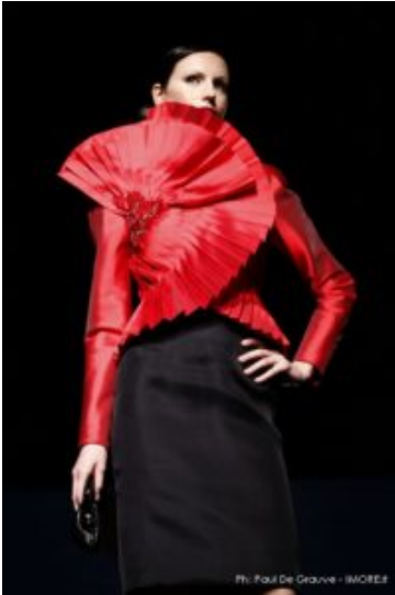
Altaroma Luglio 2009

Dopo più di mezzo secolo di attività, ci lascia una delle figure che ha indissolubilmente segnato la storia della sartoria e dell'alta moda made in Italy. Da quando nel '57 una giuria composta da nomi del calibro di Capucci, Schubert, Veneziani e Marucelli lo dichiarò vincitore di un concorso per giovani talenti, Fausto Sarli ha immaginato e disegnato una donna legata alle geometrie e all'eleganza di un tempo, ma sempre consapevolmente contemporanea.