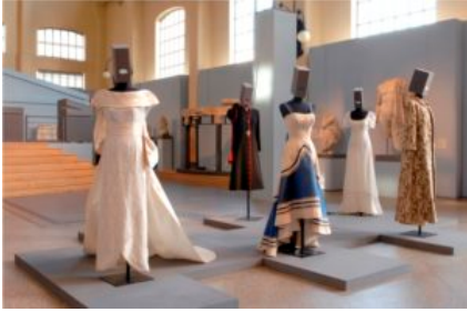
Allestimento mostra "60 anni di moda Made in Italy"

Maestri italiani dello stile, indiscussi protagonisti del fashion system internazionale, partecipano alla retrospettiva "60 anni di made in Italy" . Gli ambienti imponenti della Centrale Montemartini (polo espositivo dei Musei Capitolini) ospiteranno, dal 10 al 28 ottobre, un centinaio di creazioni particolarmente rappresentative, coprendo un arco temporale di riferimento, che va dalla stagione dell'haute couture anni '50 a proposte moda attinte dalle più recenti collezioni. Va sottolineato: la narrazione non segue una logica cronologica è basata, piuttosto, su complesse fascinazioni cromatiche, suggestioni legate alla preziosità dei tessuti, emozioni immediate e di immediata percezione che nascono dall'anima delle singole creazioni. Il risultato è un percorso organico incentrato sul gusto estetico che ha reso inconfondibile, a livello mondiale, lo stile italiano. La mostra, curata da Fiorella Galagano e Alessia Tota, è stata ideata da StilePromoItalia ed è promossa dall'Assessorato alle Politiche Culturali e Centro Storico - Sovrintendenza ai Beni Culturali di Roma Capitale, dall'Assessorato alle Attività Produttive, al Lavoro e al Litorale di Roma Capitale, con il patrocinio della Camera Nazionale della Moda Italiana e in collaborazione con Zètema Progetto Cultura.