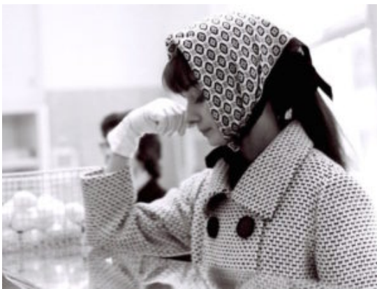
Dolce Vita Gallery

-“Ogni città nel suo genere è indimenticabile. Tuttavia, se mi chiedete quale preferisco, direi Roma....”