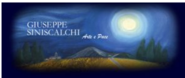
FRONTEVERSISMO di Giuseppe Siniscalchi.

Qui una cascata di stili e di emozioni si mischia e si delinea. Qui nuovi talenti vengono incoraggiati e promossi. Qui la personalità spiccata di una donna di grande stile trova casa e induce a sognare.