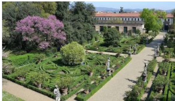
Giardino Palazzo Corsini