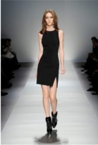
Abito Blumarine ai 2012/13

Si sa la comunicazione pubblicitaria è specchio delle esigenze economiche, sociali, politiche e culturali del momento. Il concetto che oggi preside la comunicazione delle grandi griffe è globalizzazione . Non c'è che da scegliere come testimonial una star, vestirla per un evento ad impatto globale per avere una pubblicità efficacissima capace di raggiungere attraverso la foto e la didascalia che dice "con abito di..." l'ultimo angolino del Mondo. Il nome della griffe che ha vestito su un red carpet una stella gira vorticosamente grazie ai rotocalchi; la visibilità è al massimo anche se, e dobbiamo dire purtroppo, si è verificata una rovinosa caduta nel cattivo gusto.