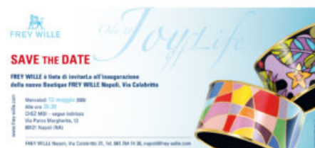
Invito Frey Wille

FREY WILLE, azienda viennese di gioielli di lusso, ha festeggiato la recente apertura della sua boutique partenopea con un evento esclusivo presso il nuovo Chez Moi, il lounge-bar più trendy di Napoli.