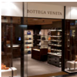
Bottega Veneta Galeries Lafayette Paris