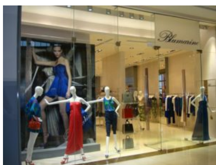
Blumarine a Dubai

Blumarine consolida la propria presenza a Dubai con la seconda boutique monomarca. Prosegue quindi con successo la crescita del brand a Dubai già presente dal 2008 con la boutique di Burjuman Center.