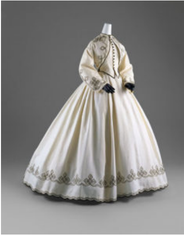
Abito bianco in cotone piqué con ricami neri

E' in corso fino al 27 maggio, al Metropolitan Museum of Art di New York, la mostra dal titolo "Impressionismo, moda e modernità", realizzata in collaborazione con l'Art Institute di Chicago e il Musée d'Orsay di Parigi.