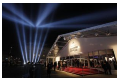
Mercedes Fashion Benz