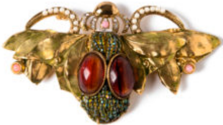
Ornella Bijoux

I bijoux italiani vantano una lunga storia, solo in parte raccontata, fatta di bellezza, moda, cultura, abilità artigianale. Se tanto resta ancora da scoprire di questo mondo delle meraviglie, importante economicamente ed esteticamente, ecco che il Museo del Bijou di Casalmaggiore - tempio riconosciuto a livello mondiale della costume jewellery made in Italy - ha ideato una brillante iniziativa che si sviluppa con un ciclo di mostre monografiche sui grandi protagonisti dell'epopea della bigiotteria nazionale.