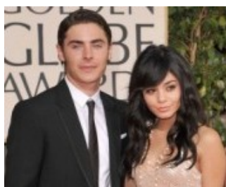
Zac Efron e Vanessa Hudgens

Giovanissimi ma già alle prese con i tappeti rossi Dominic Cooper, Nick Jonas e Zac Efron scelgono il celebre marchio inglese per la cerimonia.