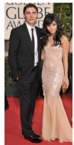
Zac Efron e Vanessa Hudgens

Zac indossa uno smoking nero firmato Burberry. Anche per lui l’abito riprende solo alcune caratteristiche dello smoking come i reverse e il fazzoletto bianco nel taschino.