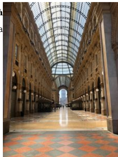
La galleria al tempo del Covid

-Come cambia Milano: la “dolce vita” che dovrà scomparire, di ANTONIO SCURATI [penetrante disamina del cambiamento di Milano nei giorni bui del lockdown]