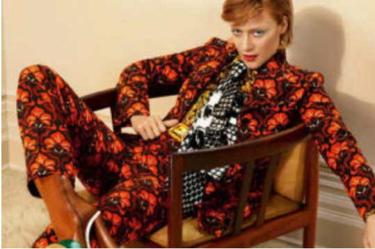
La Sevigny nella campagna pubblicitaria Miu Miu