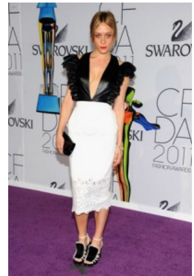
La Sevigny in una sua creazione per Opening Ceremony ai CFDA 2011

serie televisiva "Big Love" (2006-2011), in cui ha interpretato una delle tre mogli di un mormone e per cui ha vinto un Golden Globe nel 2010. Adesso continua ad alternarsi tra film e serie televisive indipendenti, come "Lovelace" (2012), di Rob Epstein e Jeffrey Friedman, sulla pornostar Linda Lovelace, interpretata da Amanda Seyfried, ma non ha mai dimenticato la moda. Infatti, ha collaborato con molte case di moda, come Chloè, e dal 2009 disegna linee di abiti per il marchio americano Opening Ceremony, sulla scia del suo personalissimo stile.