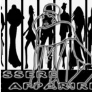
Essere o Apparire

Osannata e glorificata dagli addetti al settore e dagli appassionati, svilita al rango di fenomeno frivolo e superficiale da più menti eccelse, additata come il trionfo dello spreco e del materialismo da chi non condivide l’entità del giro d’affari messo in atto da un’industria, la cui ratio rimane ancora oscura a molti.