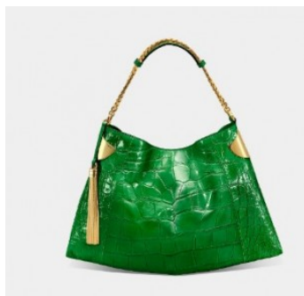
Borsa Gucci 1970