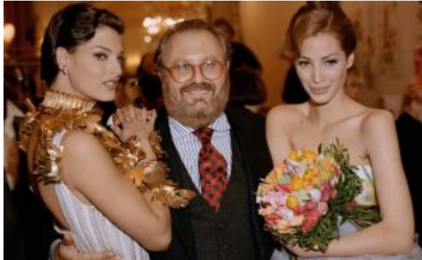
Gianfranco Ferrè tra Linda Evangelisti e Christy Turlington