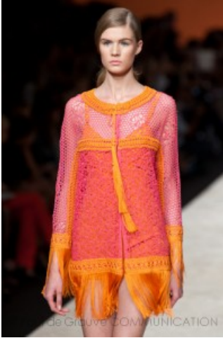
Ermanno Scervino Spring Summer 2013

Lusso in ogni uscita, in ogni capo, in ogni accessorio. Anche in un parka sportivo, anche negli abitini corti sfrangiati, perfino nei top con scollo all'americana allacciati al collo. La collezione primavera estate 2013 di Ermanno Scervino diventa la massima espressione della sartorialità della Maison, dipingendo una donna boho-chic che mixa colori e materie in modo non convenzionale.