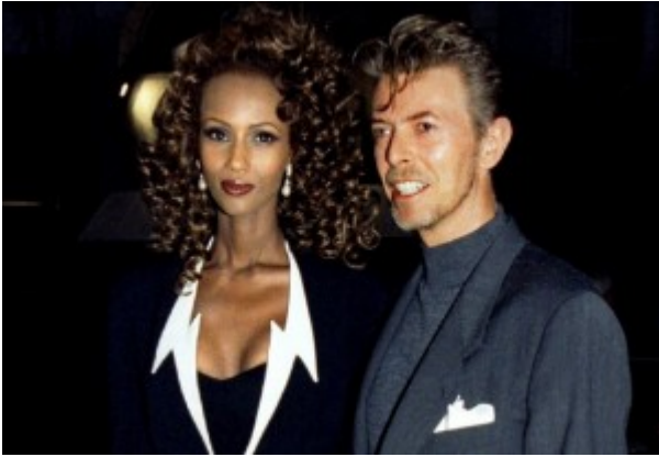
David Bowie e la moglie Iman

In mezzo secolo di carriera David Bowie , scomparso il 10 Gennaio scorso a 69 anni, non è stato solo un protagonista della scena musicale planetaria, ma ha influenzato profondamente anche il mondo della moda (spesso lasciandosene influenzare a sua volta).