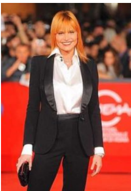
Simona Ventura in

Vediamo nel dettaglio il suo look: indossa un tailleur scuro, modello Gucci appunto, con una giacca dal taglio quasi classico con reverse stretti, lasciata aperta. Come sottogiacca, giustamente sceglie una shirt molto semplice nera, abbastanza scollata.