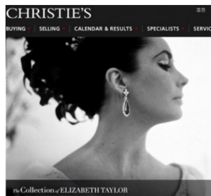
Christie's mette all'asta i gioielli di Liz Taylor

rosa, diamanti e gemme semi-preziose. Il motivo per cui Ferragamo, a questo punto del suo storico percorso, si è risolto ad entrare nel mercato dell'hard luxury è strategico: l'obiettivo, in effetti, è approfittare della fase positiva del lusso d'alta gamma per assicurarsi margini di prezzo superiori.