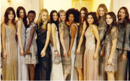
Celebrities sfilano per la pre fall collection 2012 di Alberta Ferretti

DALLA PARTE DELLE DONNE - Tra le stiliste più impegnate a favore delle donne vi è senza dubbio Alberta Ferretti, sempre in prima linea nel supportare enti non profit ed iniziative a sostegno della valorizzazione del mondo femminile, della lotta contro le discriminazioni, le violenze e lo sfruttamento del cosiddetto "sesso debole". La Ferretti, in particolare, negli ultimi anni si è distinta per il suo forte sostegno alla Jordan River Foundation, un'organizzazione non governativa nata nel 1995 e voluta dalla Regina Rania di Giordania (che ne è anche Presidente) con la missione di promuovere l'emancipazione e l'autonomia socio-economica delle donne. Nel Gennaio scorso, a Milano, la stilista romagnola ha presentato un evento speciale articolato in due momenti (passerella della pre-collezione autunno-inverno 2012/13 e sfilata di una linea demi-couture), accostando ready-to-wear ad alta moda e scegliendo come modelle non professioniste dei defilé, ma giovani donne, celebri a livello internazionale come "fashion icons" per stile e valori. Il tutto per aiutare la Jordan River Foundation a portare avanti i suoi programmi di educazione e di lotta agli abusi sulle donne e sui bambini, di stimolo alla sostenibilità sociale, di sviluppo del potenziale economico dei singoli individui e delle comunità del Paese di Rania. D'altro canto, la bellissima sovrana medio-orientale, moglie di Abdallah II e madre di 4 figli, è anche impegnata a promuovere il dialogo interculturale tra Est e