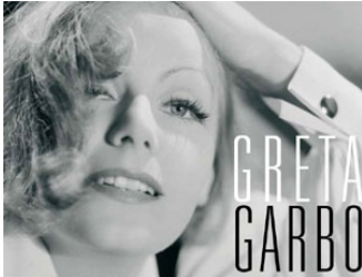
Locandina mostra su Greta Garbo

Misteriosamente femminile. Eccentricamente elegante. Raffinatamente divina. Greta Garbo . Alla “sfigne svedese”, l’attrice più celebrata di tutti i tempi, la maison Ferragamo ha voluto dedicare una mostra - “ Il mistero dello stile ” - che, partendo da Milano (dove è visitabile fino al 4 Aprile ), arriverà in varie parti del mondo. Oltre 100 modelli tra abiti e accessori, di scena e non, tra cui i sofisticati costumi creati per lei da Adrian, raccontano come è nato il suo mito di donna moderna, emancipata ed irraggiungibile, enigmatica e sofisticata, appassionata e glaciale. Tuttora irresistibile: molti degli articoli esposti saranno infatti riprodotti dallo stesso stilista fiorentino nella linea “Ferragamo Creations”.