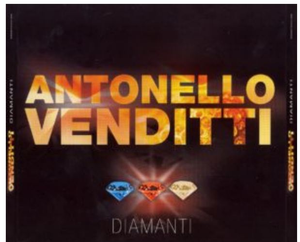
Cover dell'album di Antonello Venditti - Diamanti

Da questo cenno alla hit della Lopez si sarà capito che qui parliamo delle gemme nella canzone contemporanea, richiamando alcuni esempi che possano far capire come siffatte preziosità abbiano suggestionato ed ispirato anche il mondo della musica cosiddetta leggera.