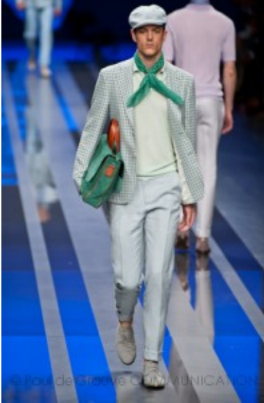
Canali - Spring Summer 2013

La primavera è iniziata da una settimana e anche se le temperature non sembrano migliorare è ora di fare un cambio armadio e pensare a cosa mettere per rinnovarsi un po'. Se alcune donne ai primi bagliori di sole nascondono i piumini, indossano fantasie floreali di ogni tipo e accessori fuxia, questo non vuol dire che gli uomini debbano fare altrettanto e risultare ridicoli come uova di Pasqua con golfini di cotone giallo canarino e camicie a fantasia primaverile rosa. Nello stesso tempo, uomini, è ora di mettere via le giacche di velluto a coste grosse, i maglioni di lana grossa e le camicie di flanella a quadrettoni scuri. Allora eccovi qualche consiglio su quali accessori indossare nei prossimi mesi.