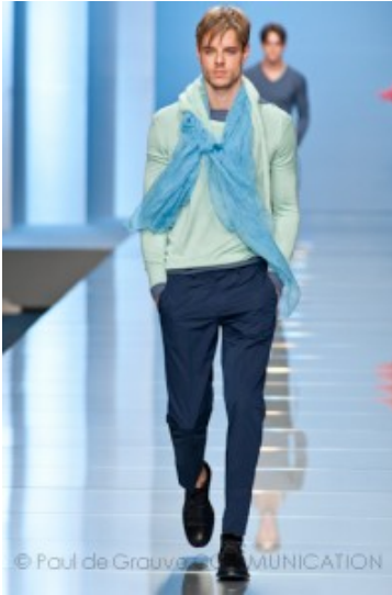
Ermanno Scervino - Spring Summer 2013

Mai scordarsi gli occhiali da sole , oltre che utili rendono fashion e attraenti. Sono tornate le lenti specchiate montate su modello tondo e astine sottili, ravvivano il look le montature in acetato in colori pop, oppure donano il fascino come una divisa quelli in stile aviatore.