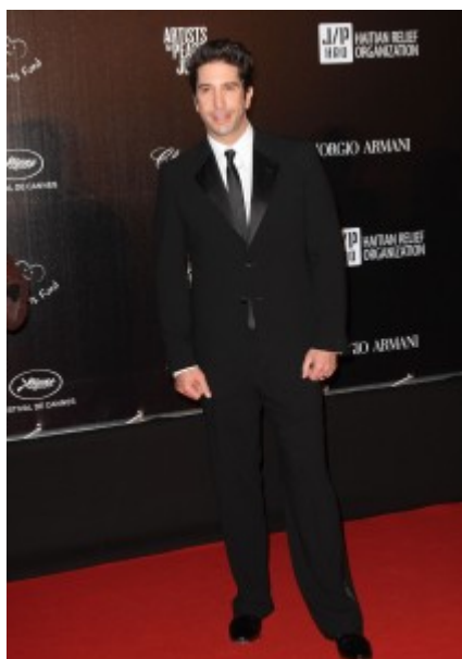
David Schwimmer in Zegna 65° Festival di Cannes

Abito allo stesso tempo formale, ma disinvolto; comodo, ma austero; tradizionale, ma aperto a molte varianti, quelle possibili pur nella staticità dell'abbigliamento maschile e la moda ha subdolamente agito per rompere alcune delle regole fondamentali di eleganza nell'indossare questo completo.