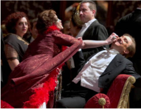
La Traviata di Ozpetek, Teatro San Carlo di Napoli

Milano sceglie Wagner, e Napoli la precede di 2 giorni nel dare inizio alla stagione lirica del Teatro S. Carlo. Nel bicentenario della nascita dei due musicisti Milano tradisce il suo Verdi e mette in scena il Lohengrin il 7 dicembre nel tradizionale giorno di apertura della Stagione Lirica. Lascia quindi il campo al S. Carlo per rappresentare il 5 dicembre La Traviata. L'opera, l'ultima della "trilogia popolare" verdiana, è ispirata a "La dame aux camélias" di Alexandre Dumas figlio, che a sua volta ricorre ad una vicenda realmente accaduta di una giovane e famosa cortigiana di Parigi dell'epoca di Luigi Filippo, Alphonsine Plessis che morì anche lei di tisi giovanissima. Verdi assiste a Parigi alla rappresentazione dell'opera di Dumas ed è una folgorazione; decide che quello sarà il soggetto della sua prossima opera per La Fenice di Venezia. Il melodramma debutta nel 1853 alla Fenice di Venezia, rivelandosi un clamoroso fiasco; il pubblico non apprezzò l'ambientazione contemporanea e neppure il soggetto decisamente scandaloso. Verdi stesso ne aveva preannunciato l'insuccesso perché giudicava i cantanti inadatti. Ma dopo pochi mesi, l'opera, ambientata nel '700 raccoglie il consenso della platea, consacrando come uno dei capolavori verdiani. Le esecuzioni successive consacrano la Traviata come uno dei capolavori dell'autore e una delle opere liriche più