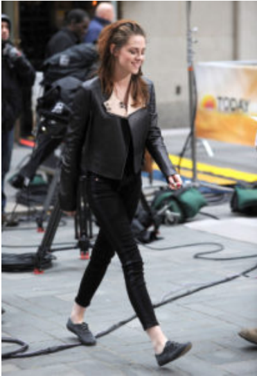
La Stewart con giacca di Belstaff e jeans di Hudson nel 2012