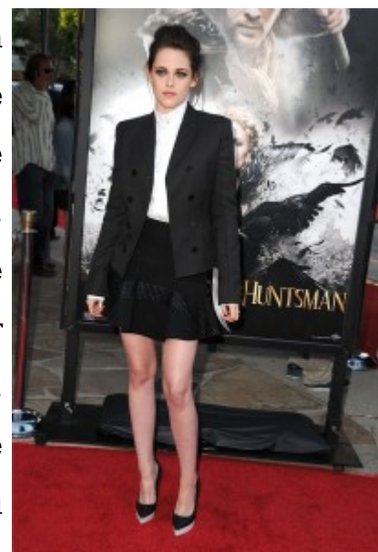
La Stewart in Stella McCartney nel 2012

Ma anche alle occasioni più importanti è difficile vederla in abito da sera, poiché predilige minigonne a pieghe, portate con camicia, giacca e décollettes ai piedi, creando look che giocano su soli due colori, nero e bianco, oppure gonne dritte, in toni scuri oppure colorate, abbinate a magliette a maniche lunghe grigio scuro; abiti corti (tende addirittura a far accorciare quelli che in sfilata vengono presentati più lunghi), aderenti o dalla gonna svasata, in colori sgargianti o in stampe dalle tribali alle floreali, sebbene i suoi preferiti siano quelli neri, resi magari particolari da piccole zone di colore diverso o da decorazioni di vario tipo; più raramente, vestiti che seguono le linee del corpo lunghi fin sotto le ginocchia. Perfino dopo essere stata nominata testimonial del profumo di Balenciaga “Florabotanica” lo scorso anno, l’attrice americana ha continuato a seguire il suo stile, pur sfoggiando ogni tanto capi del noto marchio, ed a snobbare gli abiti da sera.