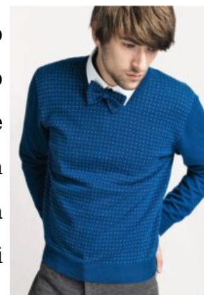
Ballantyne uomo a/i 2010

La giacca è in maglia, destrutturata e lineare. Il pull con scollo a V o stonato, è portato sopra a morbidi pantaloni dall'effetto gessato elegante, che richiamano l'abito formale. Il cardigan è proposto anche nella versione a micro pois, ottenuti da Ballantyne grazie ad una particolare lavorazione della lana in punto-spillo, che torna nella collezione per arricchire i papillon o le sciarpe. Riproste in varianti multicolor anche le classiche maglie diamond, con il diamante appunto, simbolo distintivo del marchio.