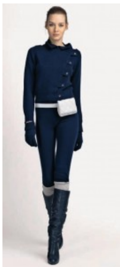
Ballantyne donna a/i 2010

pipistrello, accanto a capi dinamici e di sapore informale; e poi pantaloni cargo con maxi tasche e mini con rivetti, i tipici automatici in metallo che si troviamo abitualmente sui jeans.