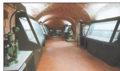
Interno del Museo

I 30.000 esemplari di “gioielli” in mostra nei loro plateaux consistono principalmente in spille, collane, bracciali, orecchini, anelli, medaglie, gemelli, realizzati con materiali