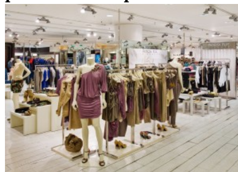
Boutique Patrizia Pepe

Quattro aperture di grande importanza per il brand Patrizia Pepe che, oltre che in Italia, sta avendo grande successo anche a livello internazionale. Una carrellata di nuove aperture sono cominciate i primi di febbraio, con il nuovo store a Vienna, nella centralissima Weihburgasse 7, a pochi passi dal Duomo, poi a marzo a Parigi, con una strategica apertura all'interno del prestigioso department store Printemps. Tornando a giocare in casa Patrizia Pepe ha aperto poi una boutique a Genova, nella storica via Roma 52/R e, per finire, il grande restauro del negozio di Viareggio, che ha riaperto il 6 marzo in viale Marconi 34, sul suggestivo lungomare, all'interno di una tipica palazzina balneare di inizio novecento. Ambienti caldi e