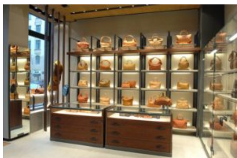
Boutique Bottega Veneta

“Praga è un gioiello e sono felice di aprire qui una nuova boutique Bottega Veneta”, spiega il Direttore Creativo Tomas Maier . “Parizska Street è una location invitante, affascinante, sofisticata e molto vivace. Per i clienti Bottega Veneta la città, la strada e la boutique rappresenteranno un’esperienza unica”.