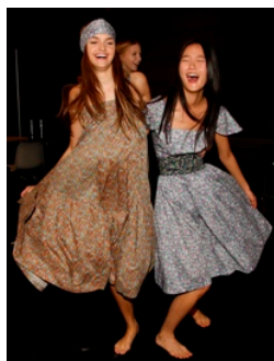
"Liberty Collection" by Cacharel

Nuove aperture italiane e internazionali per Patrizia Pepe