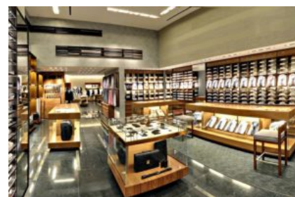
Store Zegna a Dubai

Ermenegildo Zegna inaugura, in partnership con UAE Trading Establishment, il primo Global Concept Store in Medio Oriente, progettato da Peter Marino. Situato nella nuova area dedicata al retail del Dubai Mall, lo store occupa una superficie di 437 metri quadrati all'insegna dello shopping di lusso.