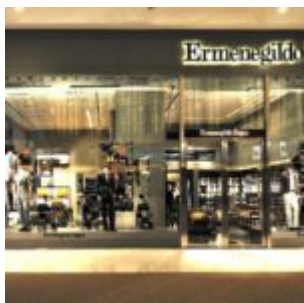
Store Zegna a Dubai