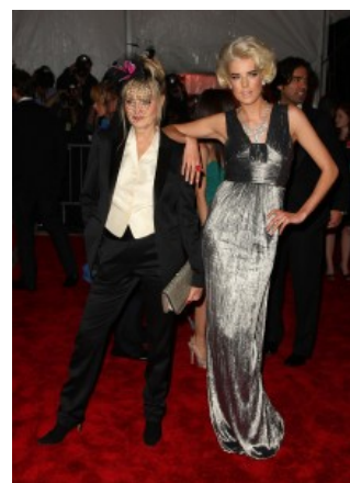
Twiggy e Agyness Deyn

Burberry ha vestito le supermodelle inglesi Agyness Deyn e Twiggy alla serata del Metropolitan Museum of Art’s Costume Benefit Gala in New York per l’apertura della mostra “The Model as Muse: Embodying Fashion” che esplora il rapporto tra alta moda e l’evolversi del concetto di bellezza.