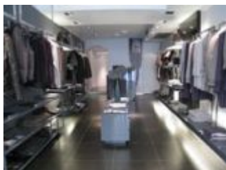
Boutique di Massimo Rebecchi a Roma