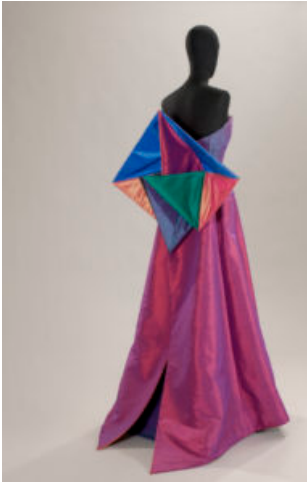
Abito di Roberto Capucci

Il Consiglio Nazionale dell'Associazione per il Disegno Industriale - ADI - ha deliberato all'unanimità la nomina di Roberto Capucci a Socio Onorario . Con questo riconoscimento si vuole ribadire il legame che intercorre fra gli abiti-scultura del Maestro e le discipline del design e dell'architettura. Il rapporto fra volumi, motivi geometrici e tessuto, come materiale di design per la costruzione dell'abito, ha inoltre ispirato la mostra "Questione di Stile. Roberto Capucci Materia e Design" attualmente in corso presso il Museo della Fondazione Roberto Capucci a Villa Bardini a Firenze. Il titolo dell'esposizione cita la rubrica che la nostra rivista on line di moda e cultura IMORE ha dedicato a Capucci. La mostra si compone di 23 creazioni realizzate a partire dagli anni '80, fino ai tailleur del 2008 e del 2009.