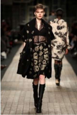
ANTONIO MARRAS A/I '10-'11

Antonio Marras esprime la sua creatività con linee proprie, quella di Alta Moda nella quale ha debuttato nel '96 ad AltaRoma, e quelle del pret-à- porter: la prima Antonio Marras , I'M un acronimo che significa Io sono ma significa anche ISOLA MARRAS , rivolta ad un pubblico giovane; il Laboratorio-Serie Limitata con capi prodotti in Sardegna, cui si affianca il Laboratorio, quasi una "stanza" sperimentale prima di affrontare la produzione industriale dei capi. Lo stilista è inoltre direttore artistico del marchio Kenzo. Grandi le suggestioni che connotano le sue collezioni.