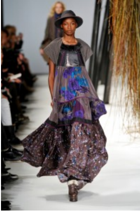
Antonio Marras per KENZO A/I '10-'11

Dal 2003 disegna la collezione Kenzo. Cosa c'è di Marras in queste collezioni? Quanto Antonio Marras deve dimenticare le sue radici per interpretare al meglio Kenzo?