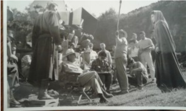
Il set di Ben-Hur

Aveva poco più di vent'anni Itala Scandariato quando Christian Dior le consegnò il premio “La tavolozza d'argento”, come riconoscimento per alcuni suoi disegni.