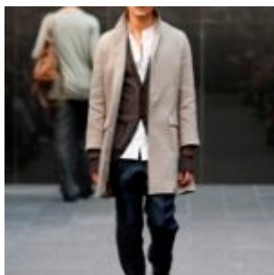
Burberry P/E 09

Il mondo della moda maschile, in apparenza più statico di quello femminile, è animato in realtà da un dinamismo carsico, in cui si celano tutti i mood dell'identità virile.