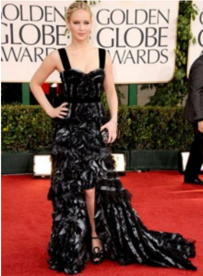
La Lawrence in Louis Vuitton ai Golden Globes 2011

Hollywood le preferisce toste: la Bella Swan di "Twilight", con la fine della saga, ha le ore contate. L'apatrica e vampiresca Kristen Stewart, sebbene due anni fa fosse l'attrice più ricercata dai registi, adesso vede la sua carriera andare a rilento, ma forse è anche colpa dei gossip sulle sue relazioni sentimentali, che hanno fatto la gioia dei giornalisti anche una volta finita l'estate. Il tempo delle eroine che a prima vista possono apparire toste, ma che in realtà non dimostrano di avere una personalità che possa affermarsi e mancano di intraprendenza, è finito. Adesso il cinema preferisce donne toste e combattive, che in alcuni casi sembrano voler nascondere la propria femminilità -e a volte anche la propria umanità-, che per fortuna e inevitabilmente esce allo scoperto.