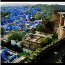
La città azzurra

Il Rajasthan è lo stato più grande dell'India e la seconda città più popolosa di quest'aerea è la "colorata" Jodhpur. Situata geograficamente proprio nel cuore di questo territorio, essa prende il nome di "città azzurra": aggirandosi fra le strette vie, si osservano le case dei brahmini, membri della classe sacerdotale, interamente dipinte d'indaco. La tradizione vuole che esse siano state tinteggiate in questa maniera affinché tutti sappiano che all'interno vive una famiglia appartenente alla prima delle classi sociali indiane. Altri sostengono, invece, che questo particolare e suggestivo colore servisse e serva ancora oggi a tenere lontani gli insetti.