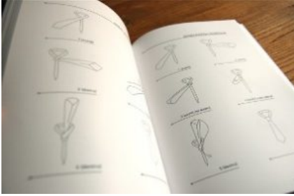
Immagine dal libro

Ad esempio a proposito della cravatta, dopo aver sinteticamente descritto tagli e struttura, illustra in modo più analitico tonalità ed abbinamenti, con tanto di foto dei campioni di possibili tessuti della cravatta. Infine una serie di illustrazioni schematiche con i vari tipi di nodi, una serie di schede con regole e consigli per la manutenzione e ancora una volta consigli sugli abbinamenti. Insomma diventa impossibile commettere errori!