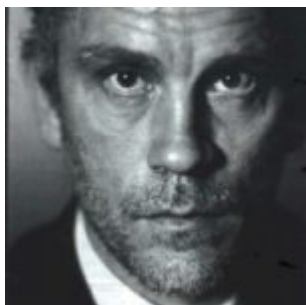
John Malkovich

Per molti, l'icona del dandysmo ai nostri giorni è incarnata dall'attore e regista americano John Malkovich, noto non solo per il modo di pensare raffinatamente eccentrico, ma anche per lo stile mai banale di cui fa sfoggio, ricercato ed elegante, attento a mescolare formale e informale, classico e bizzarro. Lui stesso, del resto, si è spinto a disegnare una linea di abiti maschili ed ora firma i prodotti di una trentina di aziende toscane, commercializzati tramite OpificioJM in una bottega di Prato di circa 600 mq (Piazza S. Marco). L'inaugurazione è prevista il 15 Giugno. In questo spazio, che "naturalmente" non è solo un negozio, ma anche un centro culturale ovvero un luogo d'incontro aperto a tutti, con bar e ristorante, è in vendita il meglio dell'eccellenza artigianale locale, dall'enogastronomia alla ceramica, dal vetro al ferro artistico, dai mobili ai gioielli, oltre agli abiti.