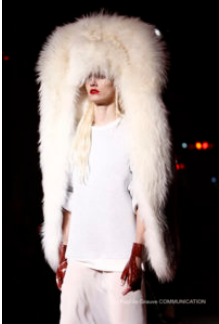
Martin Margiela

Sulle passerelle parigine il marchio Martin Margiela torna alla ribalta con una collezione ricercatamente non convenzionale, in perfetta coerenza con il background sperimentale della maison, che disegna per il prossimo autunno/inverno 2010/2011 linee e forme over, appositamente destrutturate.