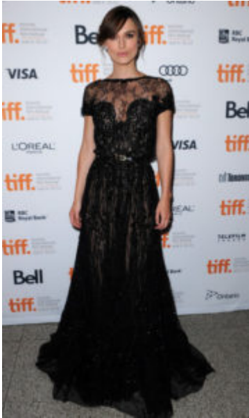
La Knightley in Elie Saab Couture al Festival del Cinema di Toronto nel 2012