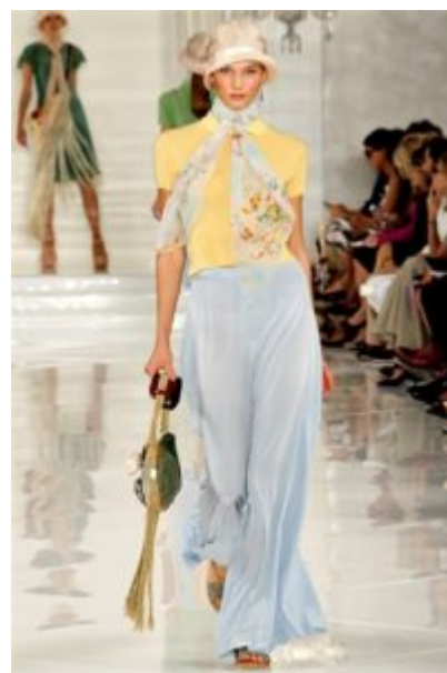
Ralph Lauren p/e 2011

Le stesse ragioni di speranza e fiducia in quegli ideali vorremmo recuperarli anche noi oggi (allorché più che mai mala tempora currunt ) e chissà se basterà una moda all'insegna degli Anni'20 a farsene ambasciatrice. Comunque, la prossima primavera vedrà il revival di abiti e accessori degni di dive alla Louise Brooks, destinati a diventare feticci anche ai nostri giorni. Ad esempio Francisco Costa, direttore creativo di Calvin Klein, ha proposto abiti retrò di seta a svasatura morbida, lunghezza a metà polpaccio, scarpe con cinturino alla caviglia, mentre Frida Giannini per Gucci ha pensato ad una moda un po' architettonica, scollati a V, preziosi ricami dorati cuciti sulla seta, scarpe con i lacci, cappellini a campana; e Ralph Lauren sembra aver attinto a piene mani al guardaroba della Daisy del Grande Gatsby, con mises in lungo, tulle arricchito di perline d'argento, piume all'altezza delle gambe, boa di struzzo, calzature stilizzate lavorate all'uncinetto.