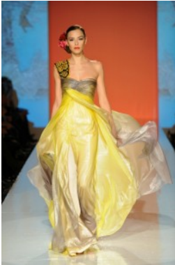
Rami Al Ali

Sulla passerella dell'alta moda romana sfila Carmen, creatura seducente, carismatica e misteriosa, proposta moda per la Primavera/Estate 2010 dello stilista siriano Rami Al Ali . La donna di Al Ali intende creare una fascinazione perturbante, si impone di catturare l'attenzione non volendosi privare di un allure di elegante raffinatezza. L'abito come espressione del carattere racchiude in sé tutte le contraddizioni del nostro tempo: la donna si sente emancipata, libera e forte eppure non può rinunciare alla magia che solo la sfera emotiva più intima e irrazionale può creare.