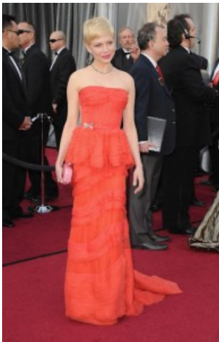
Michelle Williams in Louis Vuitton agli Oscar 2012

sempre. Abiti che le scivolano sul corpo evidenziando la silhouette senza fasciare. I colori scuri mettono in risalto l'incarnato di porcellana e il biondo dei suoi capelli. La scelta migliore è senza dubbio il Jason Wu blu notte indossato ai Golden Globes di quest'anno, abbinato all'headband che valorizza il taglio sbarazzino: composto, elegante, sobrio. Sempre di Jason Wu un abito grigio perla con un delicato fiocco di organza sullo scollo, simile al meraviglioso Chanel Couture bianco argenteo indossato agli Oscar 2011: i colori chiari la rendono eterea, irraggiungibile, quasi magica.