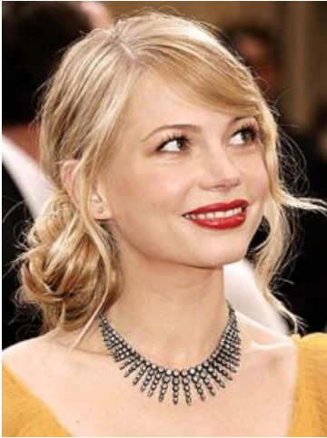
Michelle Williams agli Oscar 2006

Eterea, delicata. Fine, elegante, fragile. Bella. Di una bellezza che non capisci al primo sguardo, di una bellezza che conquista col tempo. Una bellezza non per tutti, da interpretare.