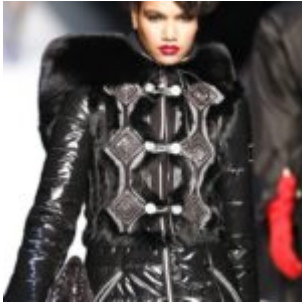
Rocco Barocco

La moda, il cinema, la danza e il mondo dello spettacolo in generale hanno prodotto nel corso della storia una serie infinita di figure mitiche, uomini e donne che, vuoi per lo charme, vuoi per lo stile, vuoi per il talento, sono diventate vere e proprie icone, modelli da emulare o semplicemente imitare. Le passerelle, i red carpets, i palcoscenici hanno immortalato e reso celebri tali personaggi, hanno coniato e perpetuato nell'immaginario collettivo il concetto di diva, l'ideale di eroina dietro al quale si nasconde costantemente un alone di mistero e sogno. Ed è proprio a questo tema che Rocco Barocco dedica la sua collezione per il prossimo autunno inverno .