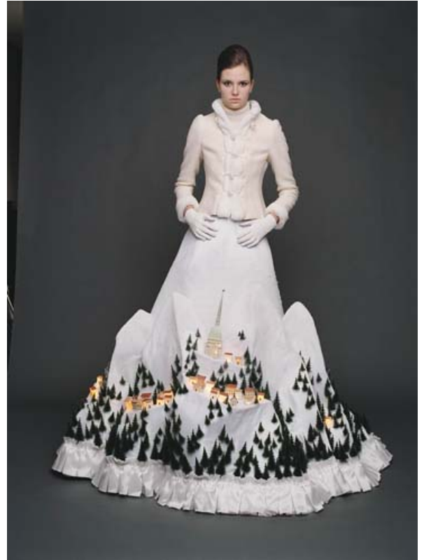
"La regina delle nevi" Moschino alle Olimpiadi invernali di Torino

Ricordate la bellissima Marlène Jobert in quello splendido film degli anni settanta "L'uomo venuto dalla pioggia" ?