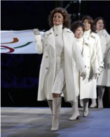
Max Mara alle Olimpiadi invernali di Torino