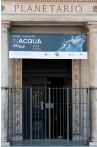
La sede della Mostra "In Acqua"

Un singolare viaggio alla scoperta dell' acqua .