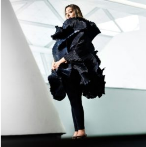
Zaha Hadid abita i propri abiti

Da pochi giorni il mondo dell'Architettura, dell'Arte, della Bellezza ha perso una luce brillante.