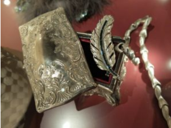
Musei Mazzucchelli

In quel di Villa Mazzucchelli a Ciliverghe di Mazzano alle porte di Brescia è allestita fino a metà novembre una mostra molto interessante.